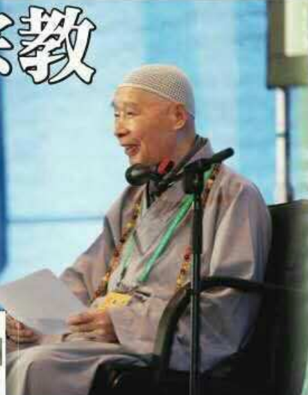
淨空老教授於本屆聯合國教科文組織國際和平大會中致詞