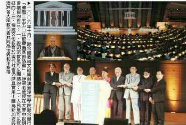
二〇〇六年十月，聯合國教科文組織與澳洲淨空學院聯合舉行「佛誕二五〇〇年國際節慶活動」。淨空老教授在大會中說明會議目的有三：一、證明宗教是可以團結的；二、人民是可以教好的；三、傳統文化教育於現代社會仍深具實用！圖為新加坡與澳洲各大宗教代表共同為世界和平祈禱。

自二〇〇六年至二〇一六年，淨空老教授在聯合國推動宗教團結、教育感化人心的豐碩成果，意味著在和平進步的時代，推廣倫理、道德、因果教育，激發人性本善，成就我愛人人、人人愛我的地球村，人類生命共同體的信念已經被世界範圍內的有識之士所接受！同時，大家也願竭盡全力、共同努力，打造人類永續的和平與可持續發展的未來，為人類歷史揭開新的一頁。