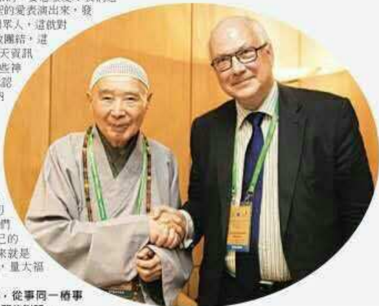
▲ 淨空老教授與法蘭西外交部宗教事務顧問若·克里希托弗·波德利先生在本屆大會期間進行親切會晤