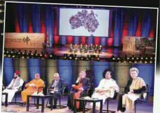
二〇一四年五月，聯合國教科文組織舉辦國際節慶活動，主辦國斯里蘭卡介紹了本國多年來大力推行宗教團結與宗教教育的情況；澳洲圖文巴代表團也分享了構建多元文化和橋樑的經驗。各國大使和代表達成共識：「應當致力於推動宗教倫理道德教育，化解各種衝突、紛爭」。