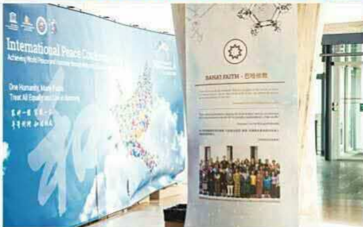
圖為本屆國際和平會議展區一角：展版所示內容豐富，不但有文化、多元宗教的精華內容介紹，還有傳統文化、漢字文圖文的介紹。