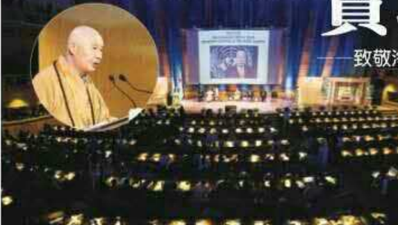
二〇一三年五月，聯合國教科文組織慶祝活動，淨空老教授在《大化淨空安住道場》的主題演講。聯合國教科文組織主任（副）Mr. Ban Ki Moon 為大會致詞時，指出「人類歷史上最重要的教育來自於宗教與文化」。並肯定「淨空老教授對於推動城市的聯合國可持續發展目標，有重要的指導意義」。