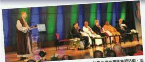
二〇一三年五月，淨空老教授應邀出席聯合國教科文組織國際節慶活動，並作《人心壞了，社會亂了，怎麼辦？》的主題演講。演講指出宗教教育是化解世界危機之必須，宗教團結是世界和平之首要；並提出中華傳統文化對社會和諧的重要性與實際案例。

二〇一六年九月十四至十六日，馬德加斯加駐澳大使館和澳洲淨空學院在聯合國教科文組織總部舉辦了為期三天的國際和平會議，法國、澳洲、印尼、剛果、安哥拉等二十多個國家的大使真誠、積極地參加了本次會議。教科文組織的兩位主要領導、副秘書長奧古澤先生與執行委員會主席羅博斯先生也出席了會議。並在大會致辭發言。這是近十年來，聯合國教科文組織重現宗教團結，倡導宗教回歸教育以拯救全球範圍的道德、人性危機，實現國際社會長治久安的又一次年度國際盛會。